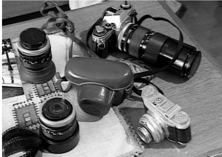
Η Canon του Δημήτρη Λέτσιου, η «μηχανή-εργοστάσιο» όπως την έλεγε, ανάμεσα στα υπόλοιπα φωτογραφικά του εξαρτήματα.

Ο κύριος όγκος του έργου του έχει γίνει με τετράγωνα ασπρόμαυρα αρνητικά 6 X 6 εκ., αν και ξεκίνησε αρχικά με φορμά 6 X 4,5 εκ. Δούλευε και σε φιλμ 35 χιλ., ίσως από ανάγκη ευελιξίας απέναντι στη βραδύτερη διαδικασία λήψης της Rolleiflex.